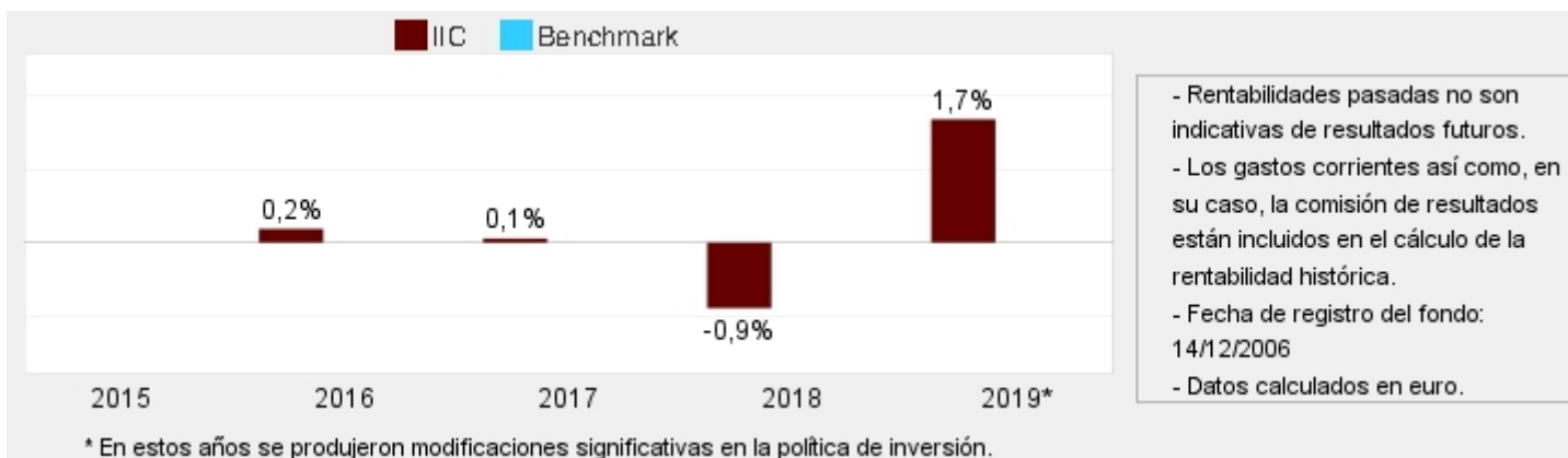
Gráfico rentabilidad histórica

Datos actualizados según el último informe anual disponible.