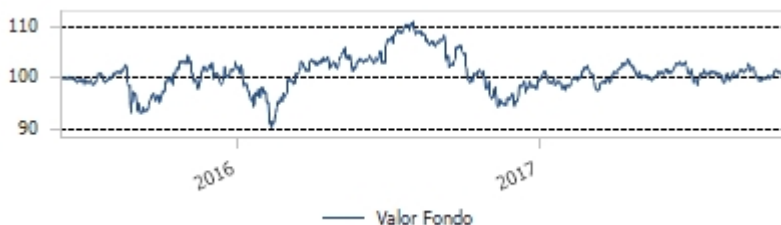
Gráfico de la evolución de la rentabilidad