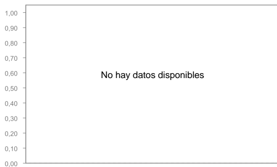
Evolución del valor liquidativo últimos 5 años