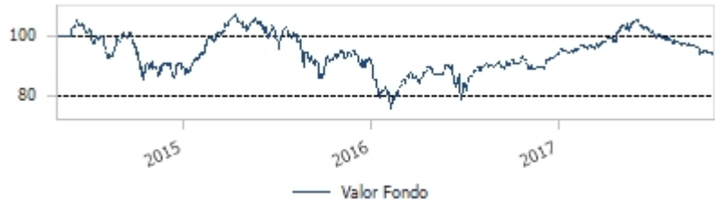
Gráfico de la evolución de la rentabilidad